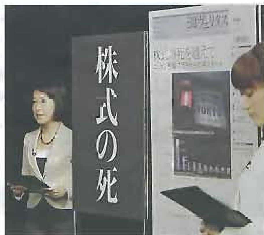
1970年代の米国のように、株価低迷に苦しむ時期は次への準備を進めるチャンスでもある