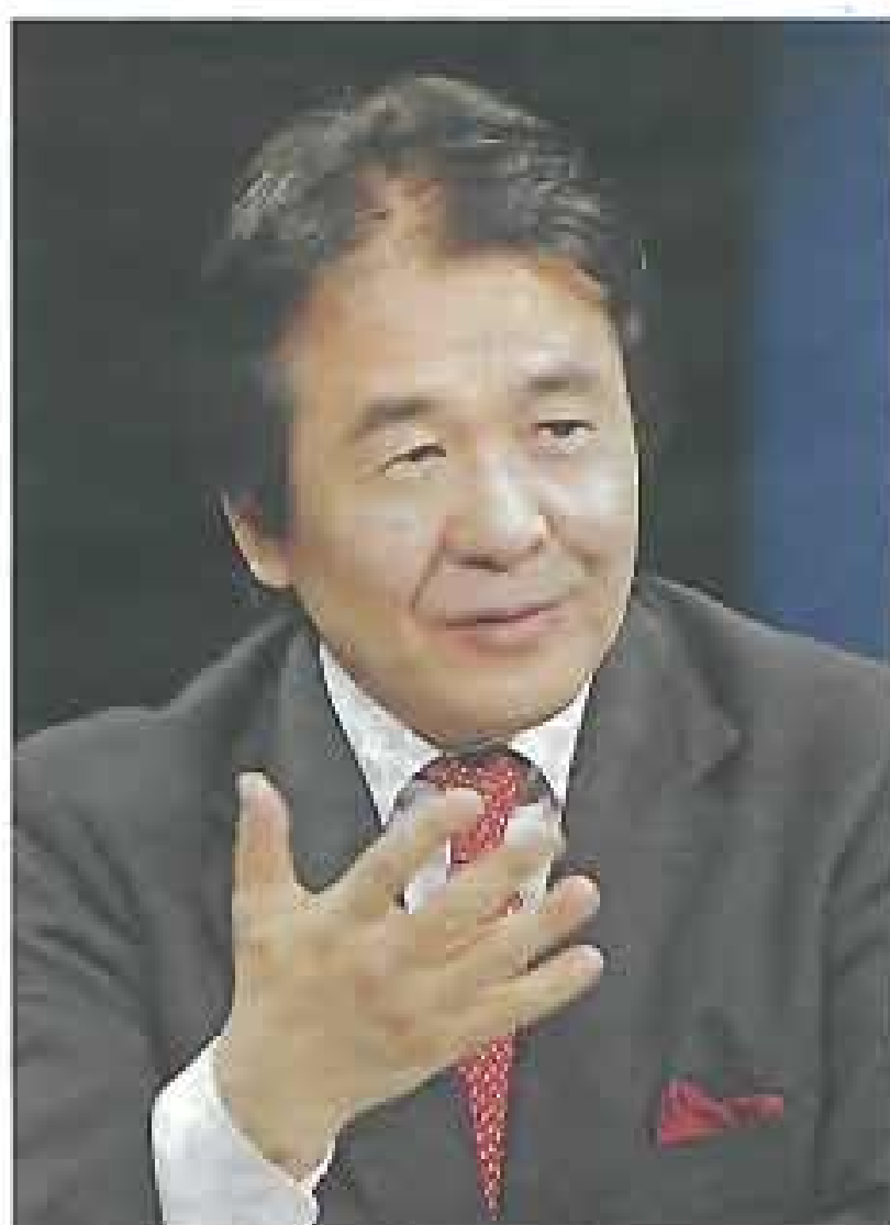
慶応義塾大学教授 竹中 平蔵氏